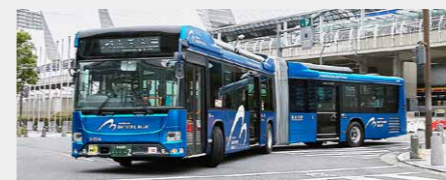
横浜市「ベイサイドブルー」についてはこちら

「分かりやすく、つかいやすく、快適、かつ移動を楽しむ」コンセプトのもと、市民のみならず、観光客の皆様の快適な移動を支え続けていきます。