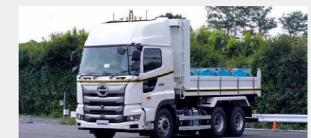
大型ダンプトラック自動運転実証実験についてはこちら